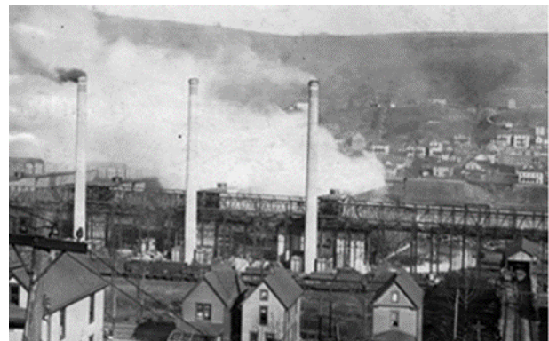
Ejemplo de usos incompatibles uno a lado de otro.

Setbacks se refiere a la mínima distancia en la que un edificio puede localizarse dentro de las líneas de la propiedad. Esto evita que las casas se coloquen muy juntas. Los setbacks pueden variar entre vecindarios dependiendo del tipo de distrito de zonificación.